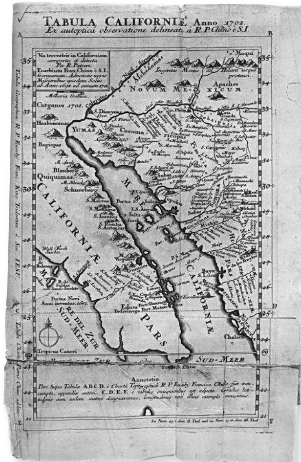
Fig. 3. Mapa atribuido al Padre Eusebio Francisco Kino, confirmando que California es una península