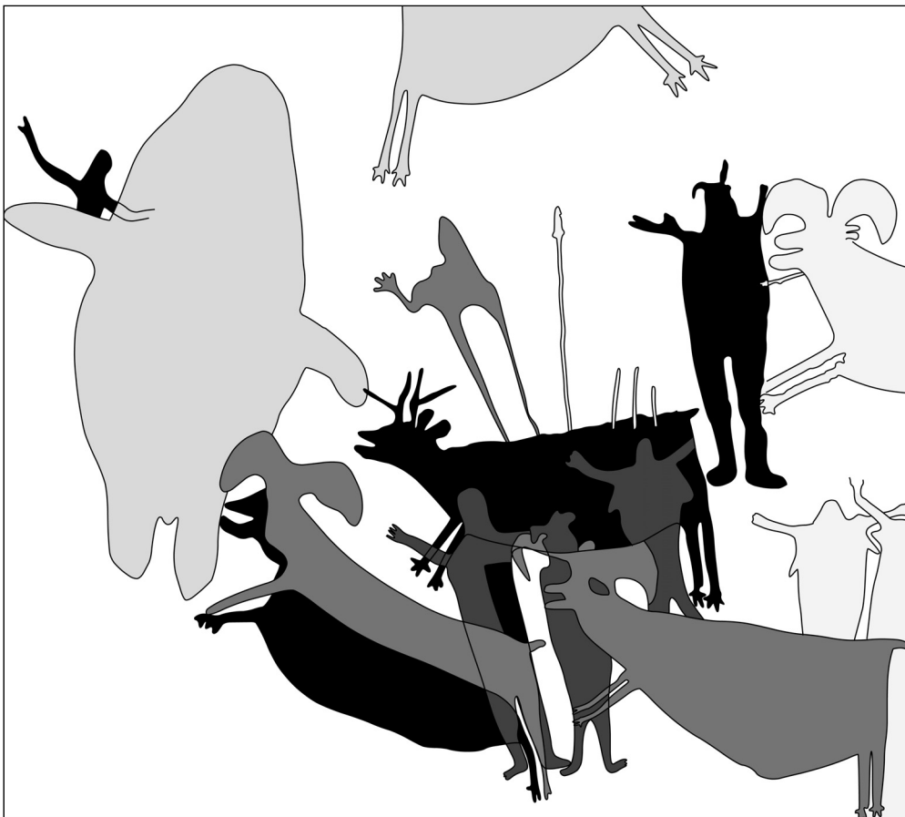
Fig. 3 Antropomorfo y ballena en la Cueva Pintada. Tomado de Viñas (2013) y redibujado por Elba Domínguez Covarrubias.